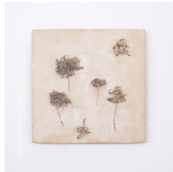
Themenreihe: la tendresse brute