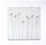
Themenreihe: la tendresse brute