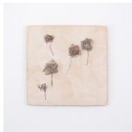
Themenreihe: la tendresse brute