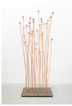
Themenreihe: la tendresse brute