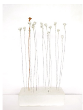
Themenreihe: la tendresse brute