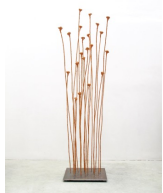
Themenreihe: la tendresse brute