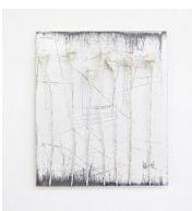
Themenreihe: la tendresse brute