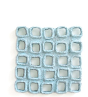
Themenreihe: hommage au mur