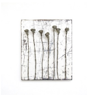
Themenreihe: la tendresse brute