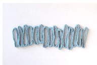
Themenreihe: hommage au mur