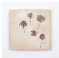
Themenreihe: la tendresse brute