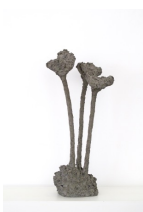
Themenreihe: la tendresse brute