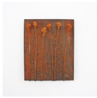
Themenreihe: la tendresse brute