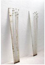
Themenreihe: la tendresse brute