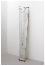
Themenreihe: la tendresse brute