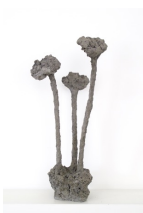
Themenreihe: la tendresse brute