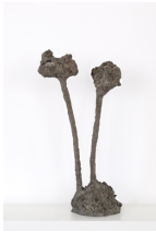
Themenreihe: la tendresse brute