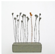
Themenreihe: la tendresse brute