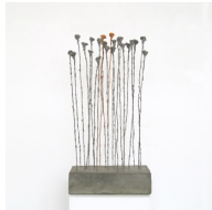
Themenreihe: la tendresse brute