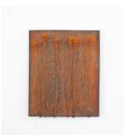
Themenreihe: la tendresse brute