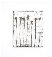
Themenreihe: la tendresse brute