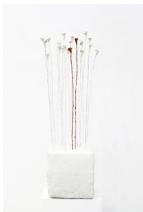
Themenreihe: la tendresse brute